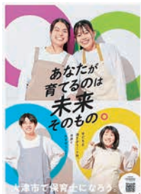
大津市の保育士募集チラシ