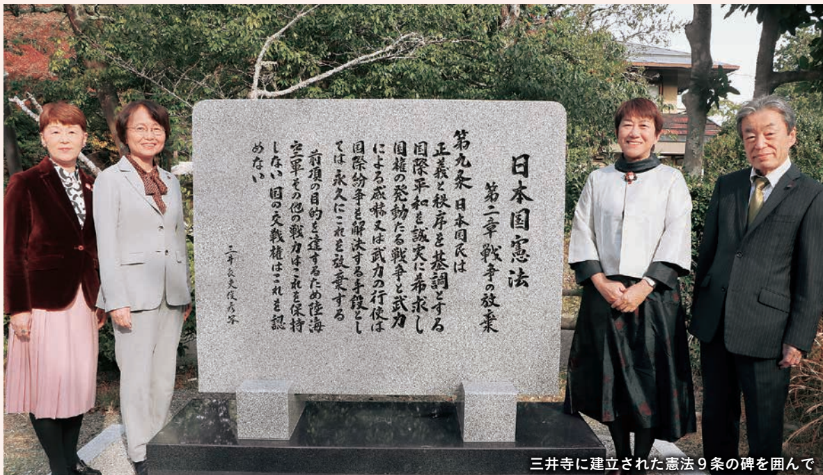
三井寺に建立された憲法9条の碑を囲んで